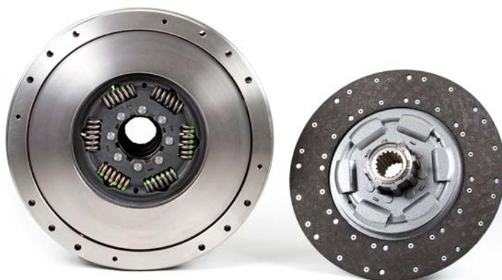
Obrázek 3: Příklad dvoulamelové spojky s různou konstrukcí nábojů