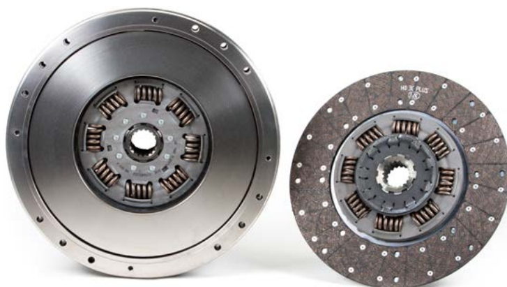
Obrázek 2: Dvoulamelové spojky LuK se stejnými profily nábojů

Dvoulamelové spojky jiných výrobců (obrázek 3) mohou být vybaveny spojkovou lamelou s prodlouženým profilem náboje. Přenos síly se u druhé spojkové lamely neprovádí přes náboj na vstupní hřídeli převodovky, ale vede přes vnitřní ozubení na náboji první spojkové lamely.